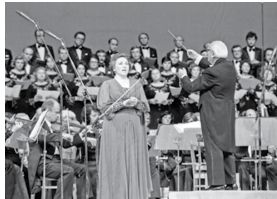
София, 9 октомври 1985 г. Изпълнение на н.а. Гена Димитрова на арията от „Норма“ от Винченцо Белини под съпровода на Симфоничния оркестър на Българското радио и телевизия с диригент н.а. Асен Найденов по време на галаконцерта по случай историческата XXIII Генерална конференция на ЮНЕСКО в София в Зала 1 на НДК.