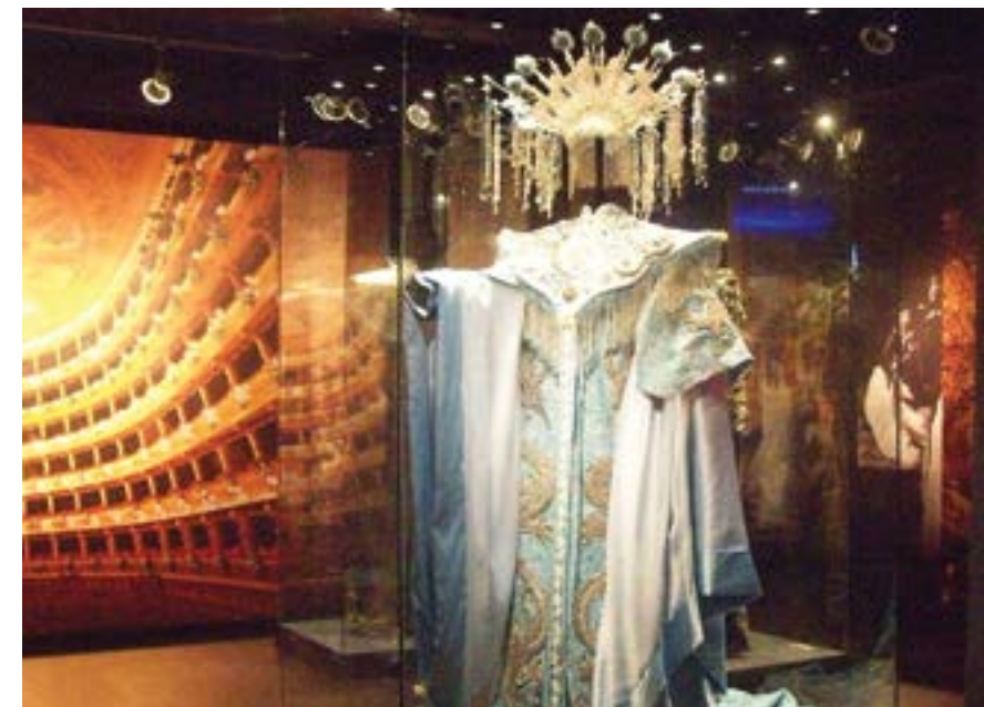
Плевен, 30 юни 2009 г. В града е открита музейна експозиция, посветена на живота и творчеството на оперната прима Гена Димитрова. Събитието съвпада с четиригодишнината от кончината ѝ. Сред експонатите е костюмът на Турангот, с който звездата е участвала в постановка на Франко Дзефирели на сцената на Метрополитен опера.

Идеята е реализирана с финансовата подкрепа на местните власти и съдействието на семейството на певицата, както и със средства, предоставени от Държавната парично-предметна лотария. Експозицията разказва за изявите на Гена Димитрова в най-престижните оперни