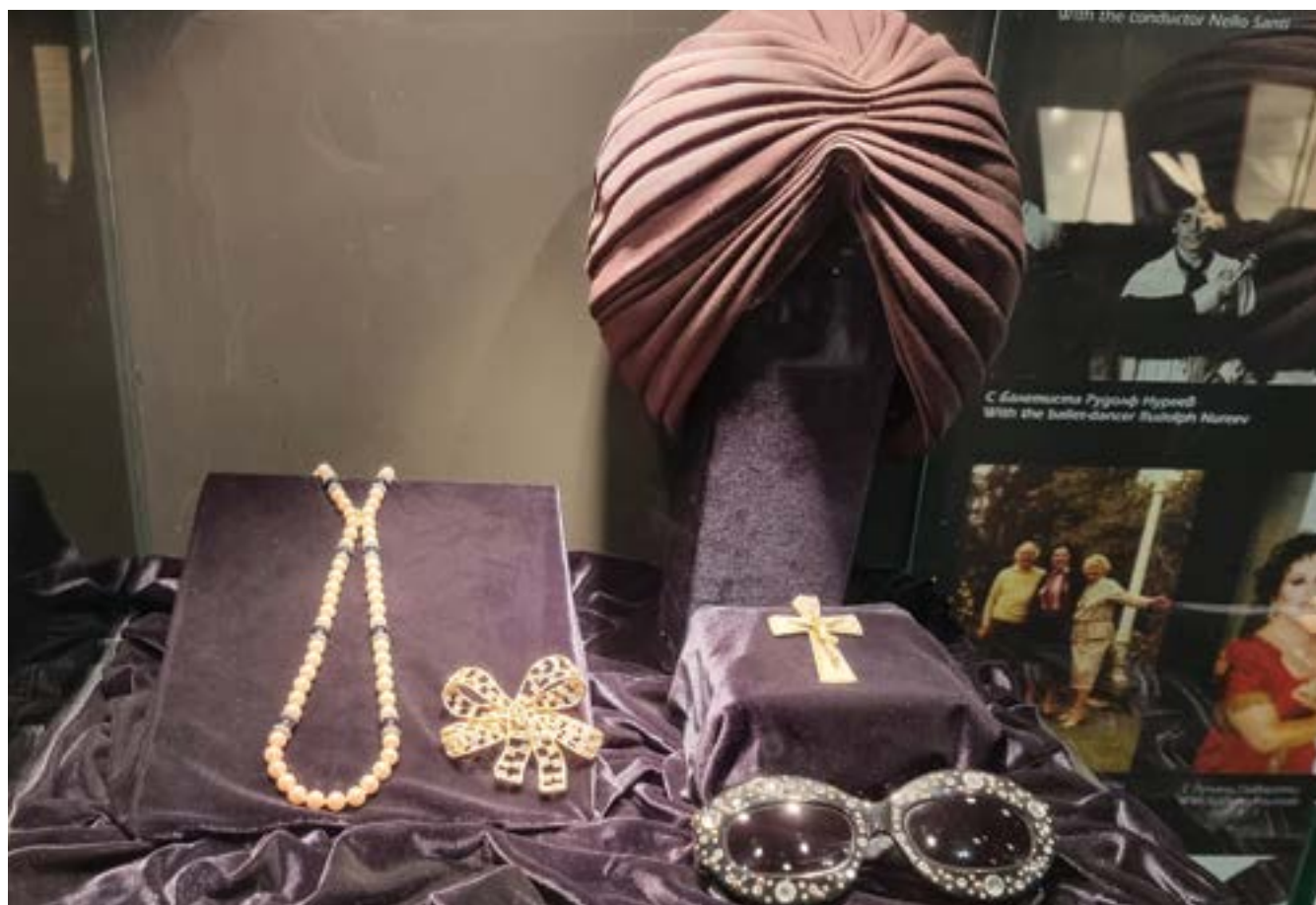
Повече от десетилетие специално създадената експозиция в Плевен разказва за живота и творческия път на оперната прима.