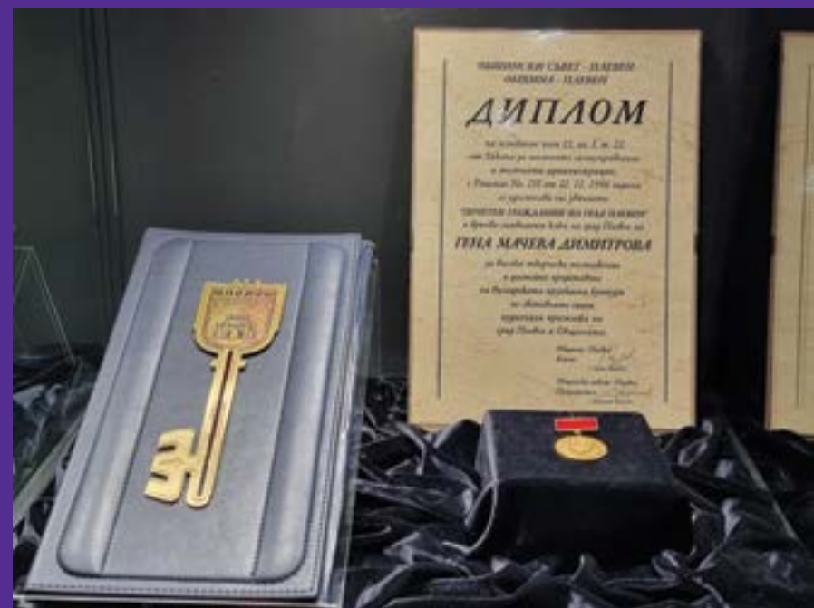
В музея са изложени и Диплом за почетен гражданин на град Плевен и ключ на града, връчени на Гена Димитрова през 1996 г.

подчертава ръководителят на отдел „Нова и най-нова история“ в плевенския музей. Показани са афишите и плакатите, статии в пресата, които информират за нейните гастролни и изключителни успехи в най-известните оперни театри в Япония, Великобритания, Франция, Южна Америка, САЩ, Египет, Испания.