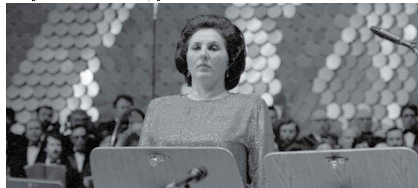
София, 27 февруари 1985 г. В Зала 1 на Народният дворец на културата „Людмила Живкова“ в столицата се провежда концертно изпълнение на операта „Турандот“ от Джакомо Пучини в изпълнение на народната артистка Гена Димитрова.

Наивни хора има и има много, които си мислят, че ако са талантливи, целият свят им е дължен. Не, единственият си ти, който ще отговаря за таланта, и ще гадеш всичко, за да го развиеш.