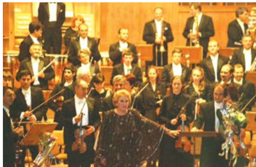
София, 3 октомври 1997 г. Гена Димитрова пее при откриването на сезона на сцената на концертна зала „България“.

Колекцията на „Гега Ню“ с право може да се нарече тържество на добрия вкус. Тя включва широк репертоар от съвременна българска музика, автентичен фолклор, джаз-фолк, както и традиционна класическа музика. Сред представените артисти личат имената на Райна Кабауванска, Никола Йезелев, Гена Димитрова, Емил Наумов, Теодоси Спасов, трио „Българка“,