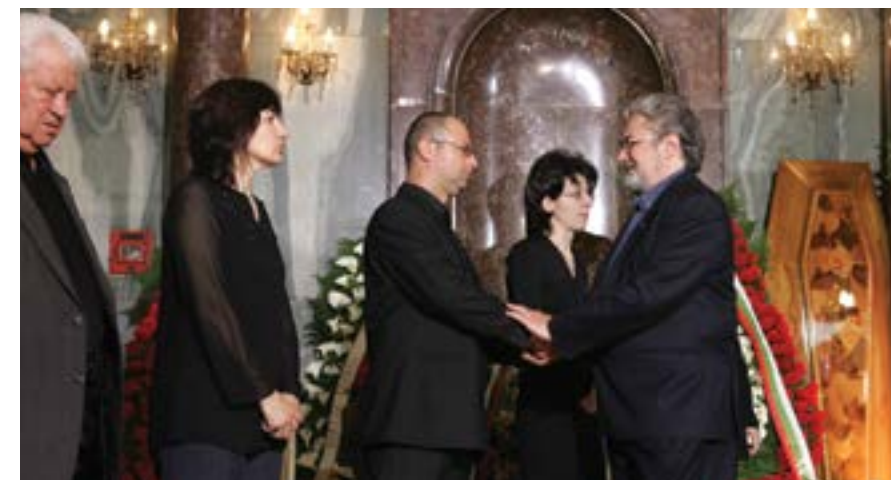
София, 16 юни 2005 г. Стоици хора се покланят пред световноизвестната оперна певица Гена Димитрова в Националната опера. Сред тях са оперният певец Никола Гюзелев и лидерът на БСП Сергей Станишев.

Министърът на външните работи на Австрия Урсула Пласник също изпраща съболезнователно писмо до близките на Гена Димитрова. „Смъртта на изключителната певица е голяма загуба за музикалния живот в България – се посочва в него. – Както България с право се гордее, че в страната се е родил такъв талант, ние в Австрия сме