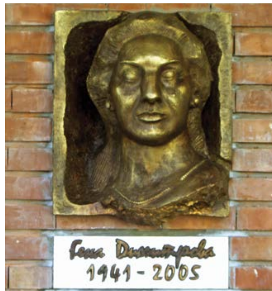
Плевен, 4 октомври 2006 г. Кметът на града открива бронзов барелеф на Гена Димитрова, поставен в нейна памет на общинската сграда, която носи името ѝ. Автор и изпълнител на скулптурната творба е плевенският художник Красимир Рангелов.

На възпоменателното тържество прочувствени слова за живота и творческите достижения на Гена Димитрова произнасят нейната сестра Надка Русева и дългогодишната ѝ приятелка историчката Свобода Гюрова. Кметът на