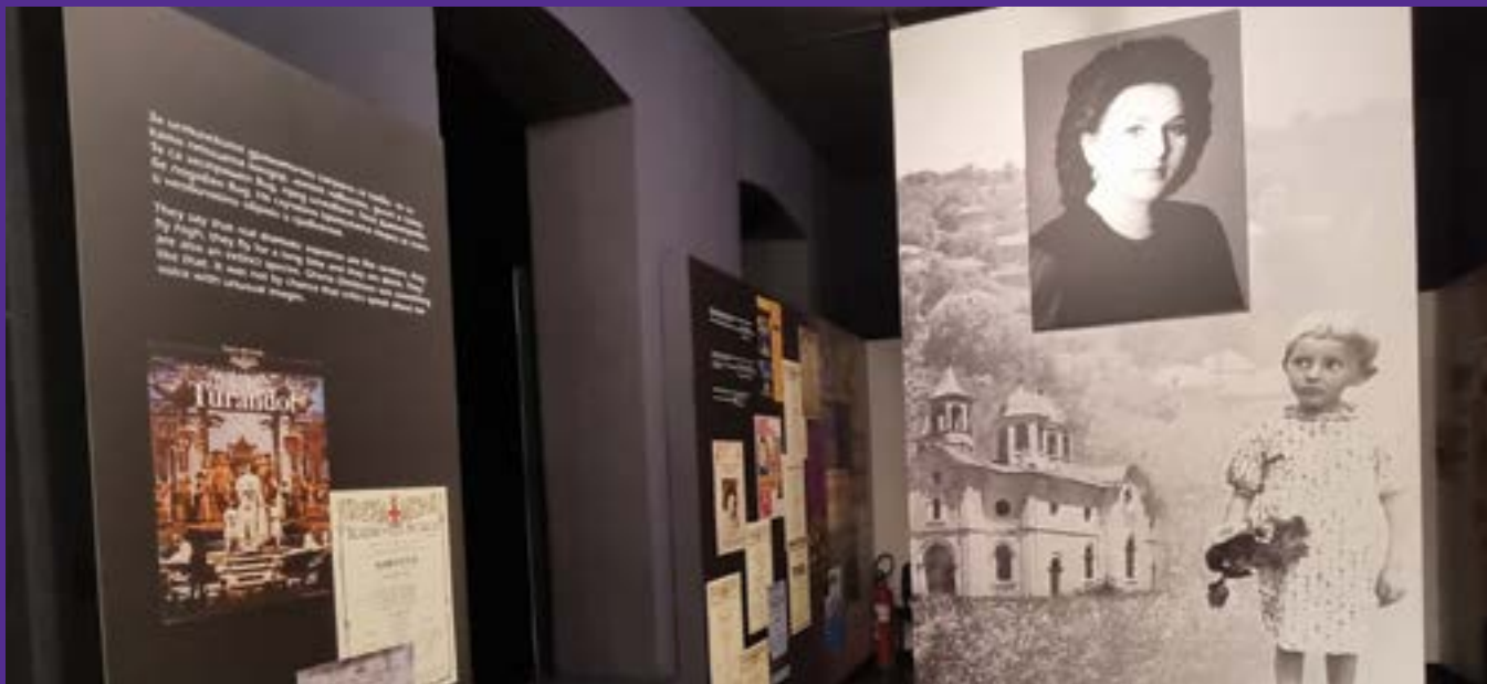
Специално създадена експозиция в Регионалния исторически музей (РИМ) в Плевен разказва за живота и творческия път на оперната прима Гена Димитрова.