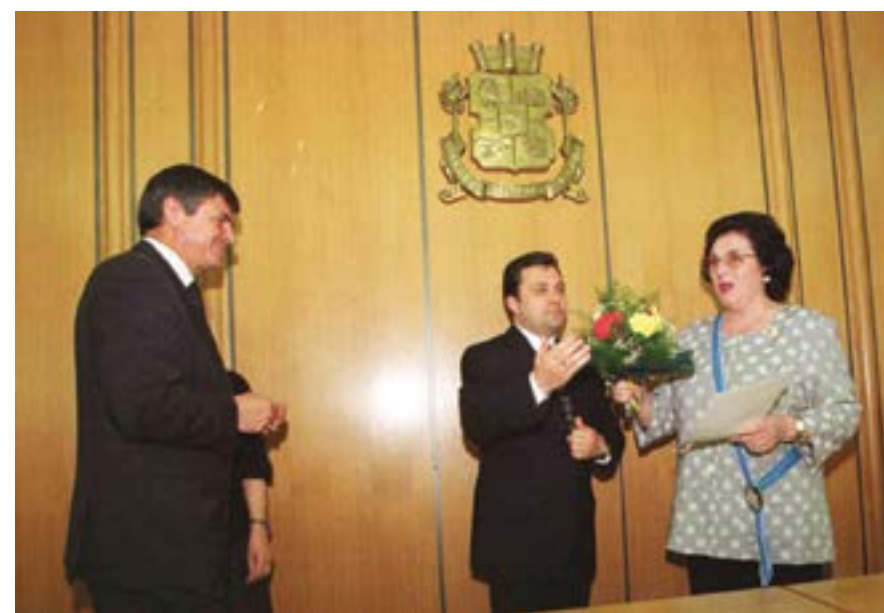
София, 23 май 2001 г. Гена Димитрова е удостоена със званието „Почетен гражданин на София“ на сесия на Столичния общински съвет.