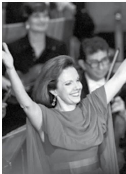
Райна Кабаиванска през 1991 г.