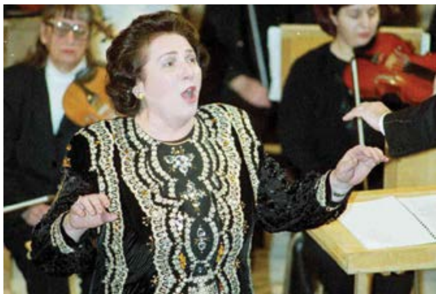
Варна, 12 декември 2001 г. Оперната прима Гена Димитрова представя своите ученици пред публиката във Варненския драматичен театър.

искрените си поздравления по повод Вашия двоен празник. Образите, които пресъздават на музикалната сцена, имат своето неповторимо място в музикалното пространство на България и на света. Вашето творчество се е превърнало в емблема на страната ни. Вярвам, че изкуството ви ще продължи да докосва сърцата на публиката и да ви носи творчество и удовлетворение. Бъдете здрава, бъдете все така вдъхновена. Прекланям се пред таланта ви!“