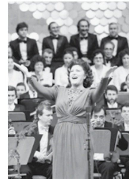
Анна Томова-Синтова през 1989 г.