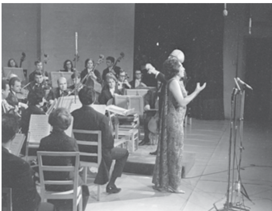
София, 25 май 1970 г. Изпълнение на Гена Димитрова на тържествения концерт на лауреатите от Четвъртия международен конкурс за млади оперни певци.

радостно напрежение изявята на представителите на световната певческа слава, участници в голямото благородно състезание на полето на изкуството“, пише БТА на 24 май.