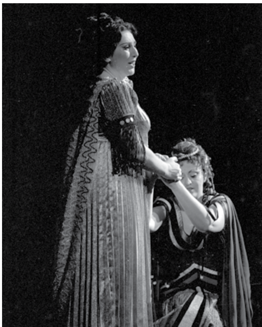
София, 27 май 1983 г. В рамките на Международния фестивал „Софийски музикални седмици“ Софийската народна опера представя операта „Норма“ с участието на н.а. Гена Димитрова и Карло Косута.

За честването са показани фрагменти из операта „Аида“ и балета „Козият рог“. Публиката възнаграждава с възторжени аплодисменти и цветя изпълненията на артистите.