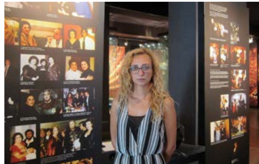
Плевен, 22 август 2018 г. Уникална експозиция за оперната прима Гена Димитрова в Плевен привлича хиляди туристи от България и чужбина, казва за БТА Десислава Близнашка, специалист в Регионалния исторически музей в града.

В препълнената зала „Дворана“ на Министерството на