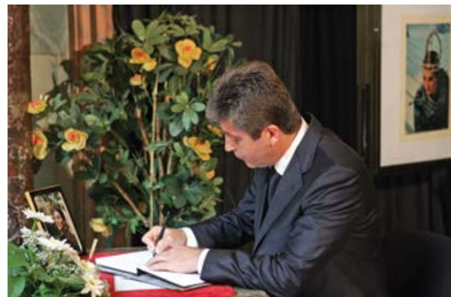
София, 16 юни 2005 г. Президентът Георги Първанов също се покланя пред Гена Димитрова и се разписва в траурната книга в Националната опера.

„Отиде си едно огромно сърце, един неповторим човек, феноменален глас, усъвършенстван по начин, по който много малко артисти умеят