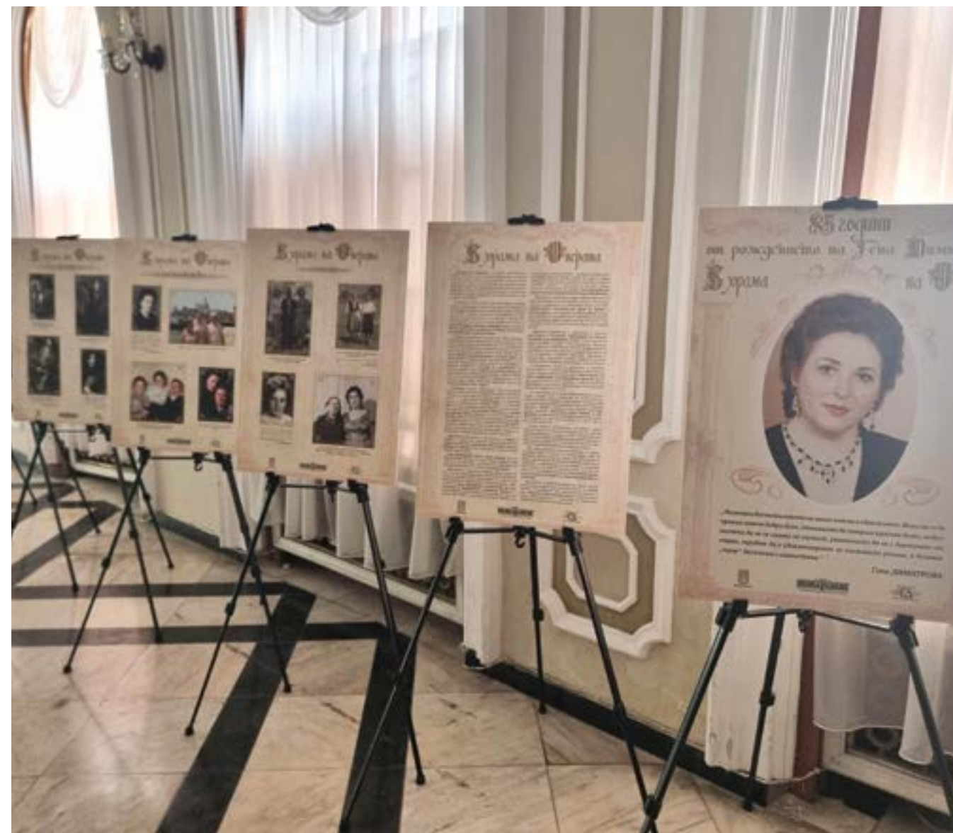
Плевен, 21 май 2026 г. Във фоайето на Драматично-куклен театър „Иван Радоев“ в града е представена фотодокументална изложба „В храма на операта“, посветена на живота и творческия път на оперната прима Гена Димитрова. Експозицията е посветена на 85-годишнината от рождението на певицата.

По време на музикалния спектакъл мултимедията представи моменти от интервюта на Гена Димитрова и нейни сценични превъплъщения в известните ѝ роли, с които покорява световните оперни театри.