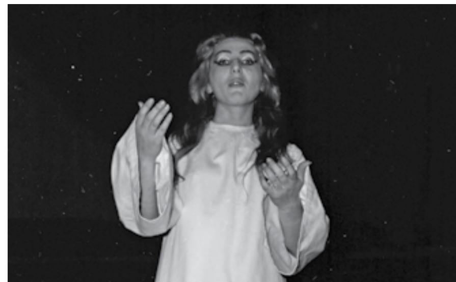
София, 29 май 1968 г. Гена Димитрова в ролята на Абигайл в Софийската народна опера.

Това е първата българска опера с участието на певицата, която влиза в ролята на героинята, гала името на спектакъла. В новината, публикувана в бюлетин на БТА на този ден, пише следното: „Тази вечер Софийската народна опера започна своя шестдесети сезон, който съвпада с първото оперно представление на сцената на „Оперна гружба“