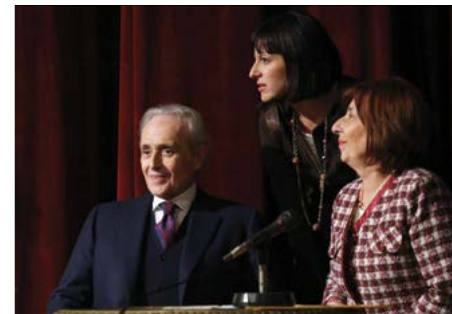
София, 9 декември 2012 г. Прочутият испански тенор Хосе Карерас е почетен гост на премиерата на книгата на журналиста Димитър Сотиров „Гена Димитрова от А до Я“ в Софийската опера.

Книгата „Гена“ на автора Александър Абаджиев на ита-