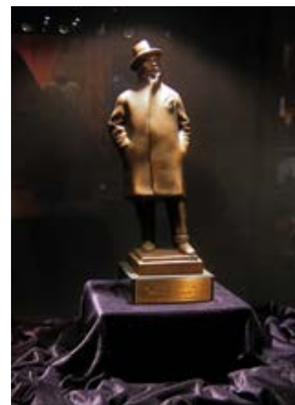
През 1989 г. Гена Димитрова е удостоена с наградата „Джокомо Пучини“ за цялостна творческа дейност. През 2018 г. статуетката е в плевенския музей, където е изложена.

В началото на май операта е показана 10 пъти в градския древноегипетски храм на Луксор от италианския оперен театър „Арена ди Верона“. Сега представленията ще бъдат изнесени от състава на театъра в град Бари (Италия). В спектаклите са пока-