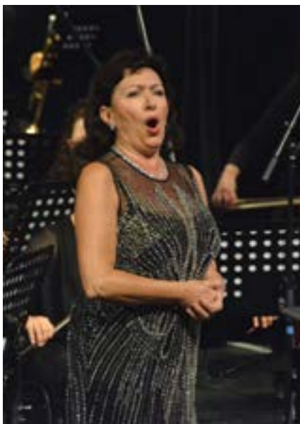
Красимира Стоянова през 2021 г.