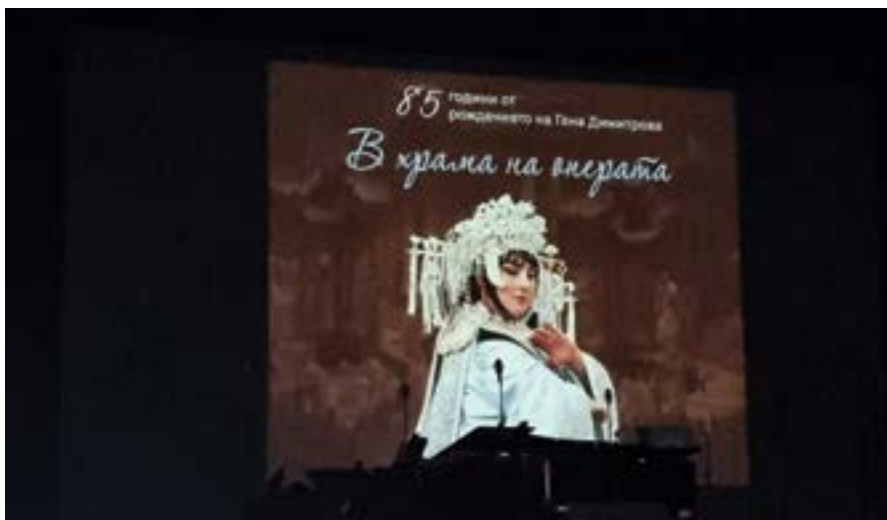
Плевен, 21 май 2026 г. В града се провежда концерт-спектакъл „В храма на операта“, посветен на 85-годишнината от рождението на оперната прима Гена Димитрова. Реализацията на музикалното събитие, което привлича многобройна публика в салона на Драматично-куклен театър „Иван Радоев“, е на Община Плевен и Общински хор „Гена Димитрова“.