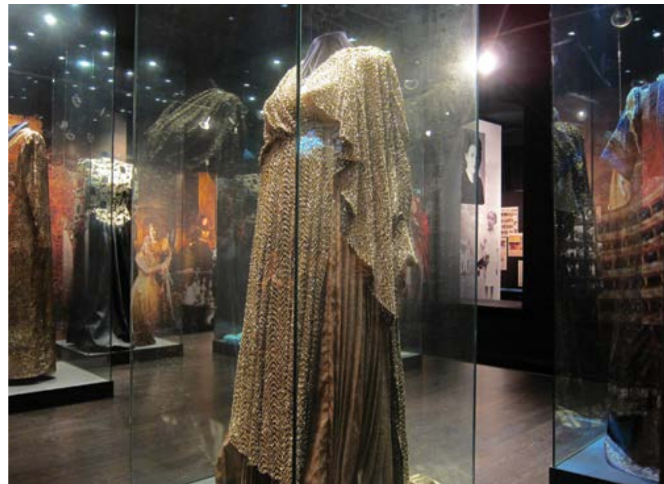
Плевен, 22 август 2018 г. Разходка из експозицията за оперната прима Гена Димитрова в музея в града.