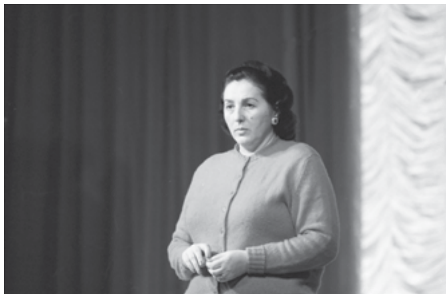
София, 21 април 1988 г. Открит урок на Гена Димитрова с млади оперни певци в Националния академичен театър за опера и балет.