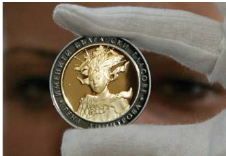
София, 29 април 2011 г. Нова Възпоменателна трикомпонентна монета „Гена Димитрова“ е представена в БНБ.