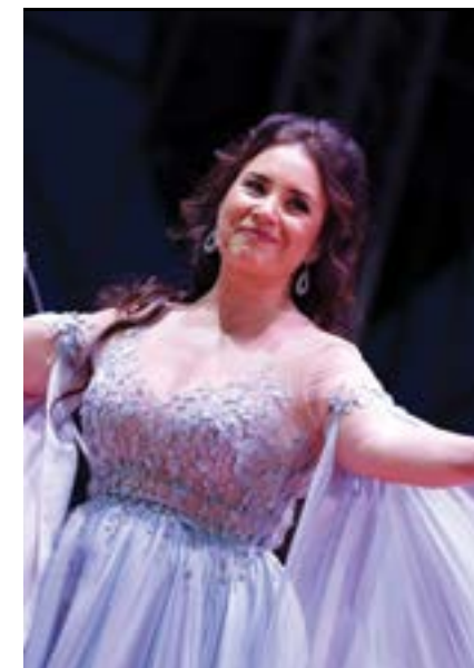
Соня Йончева през 2021 г.

Ако днес съм лиричен сопран, то е защото съм в такова душевно състояние, нали гласът е отражение на душата.