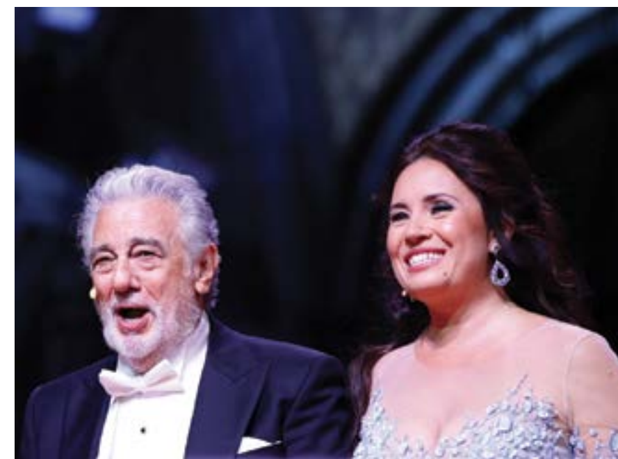
София, 31 август 2021 г. Оперната прима Соня Йончева и Пласидо Доминго изнасят концерт пред катедралния храм „Св. Александър Невски“. Програмата включва популярни арии и дуети от прочути опери.

зи са съсредоточени единствено върху ролята и сценичните си ангажименти.