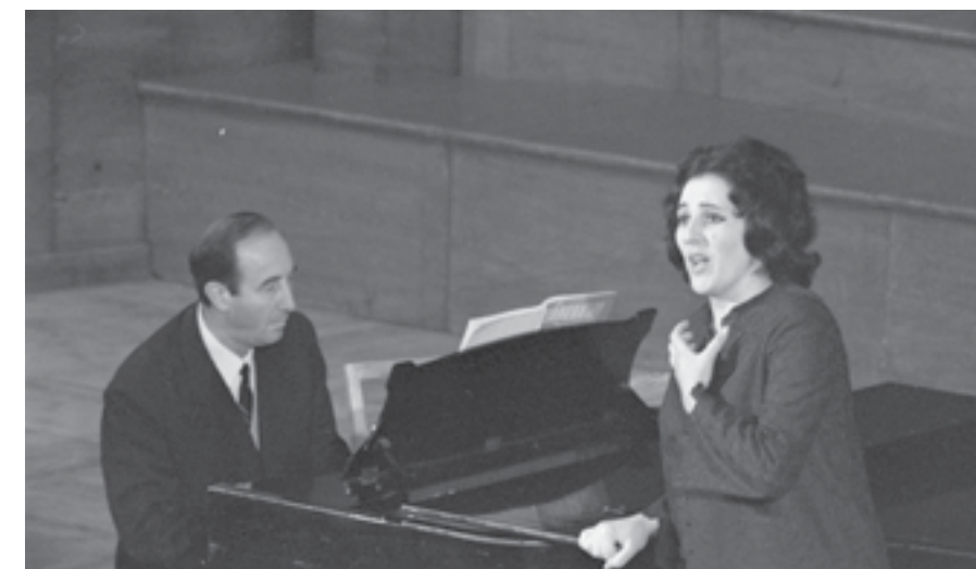
София, 6 май 1970 г. Гена Димитрова на Четвъртия международен оперен конкурс.