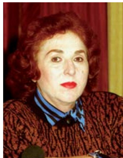
София, 21 ноември 1996 г. Портрет на световноизвестната оперна певица Гена Димитрова.

Гена Димитрова става почетен член на Софийската опера