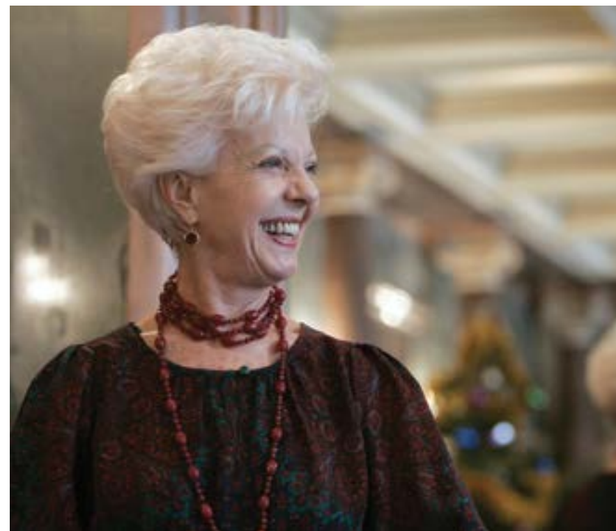
София, 7 декември 2010 г. Райна Кабаиванска дава пресконференция в Софийската опера и балет, където започват репетициите на операта „Бохеми“ от Джакомо Пучини с участието на млади изпълнители от България и Италия – ученици на оперната прима.

Сред големите имена от втората половина на ХХ век Райна Кабаиванска заема специално място. Тя принадлежи към онзи тип артисти, при които гласът и сценичното присъствие са в неделимо цяло – не само демонстрация на техника и вокално майсторство, а изграждане на драматична правдивост. Това е актриска, която запленява и убеждава.