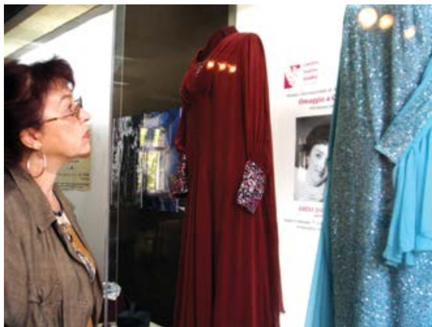
Плевен, 14 юни 2006 г. Регионалният исторически музей в града поддържа уникална изложба в памет на оперната прима Гена Димитрова по повод една година от кончината ѝ.