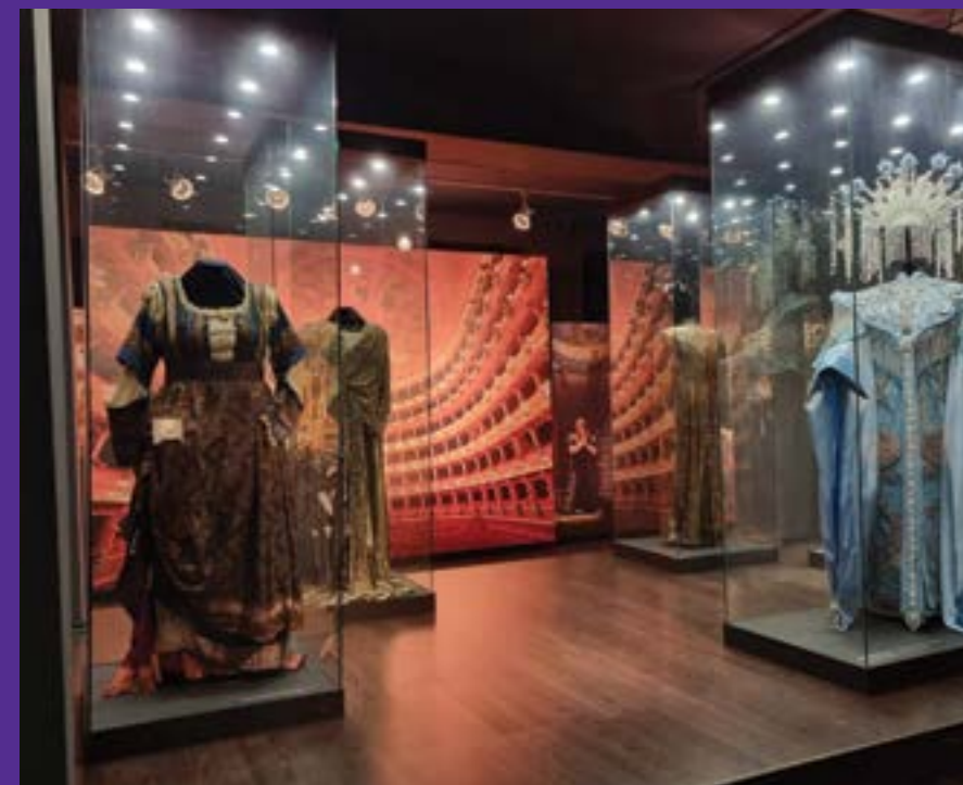
Част от експонатите представят сценични костюми, в които Гена Димитрова изпълнява някои от най-незабравимите си оперни образи.

Инициатор на дарението е семейството на оперната прима – сестра ѝ Нагка Русева и осиновената ѝ племенница Милена Стойкова. Те подаряват на музея материали, свързани с житейския път и творческата кариера на изпълнителката. Дарението