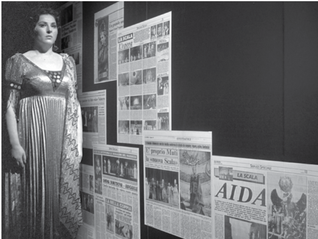
Колаж със снимка на БТА на Гена Димитрова от 1983 г. и участието ѝ в операта „Норма“ със Софийската народна опера, и с кадър със страници от международни издания, проследяващи кариерата ѝ, които са изложени в РИМ-Плевен.

Когато Гена Димитрова излезе на сцената, присъствието ѝ няма как да остане незабелязано – както от колегите ѝ, така и от почитателите на оперното изкуство, от журналистите и музикалните критици. Впечатляващите ѝ гласови данни я превръщат в явление, за което в медиите по света се пише с възхищение и възторг.