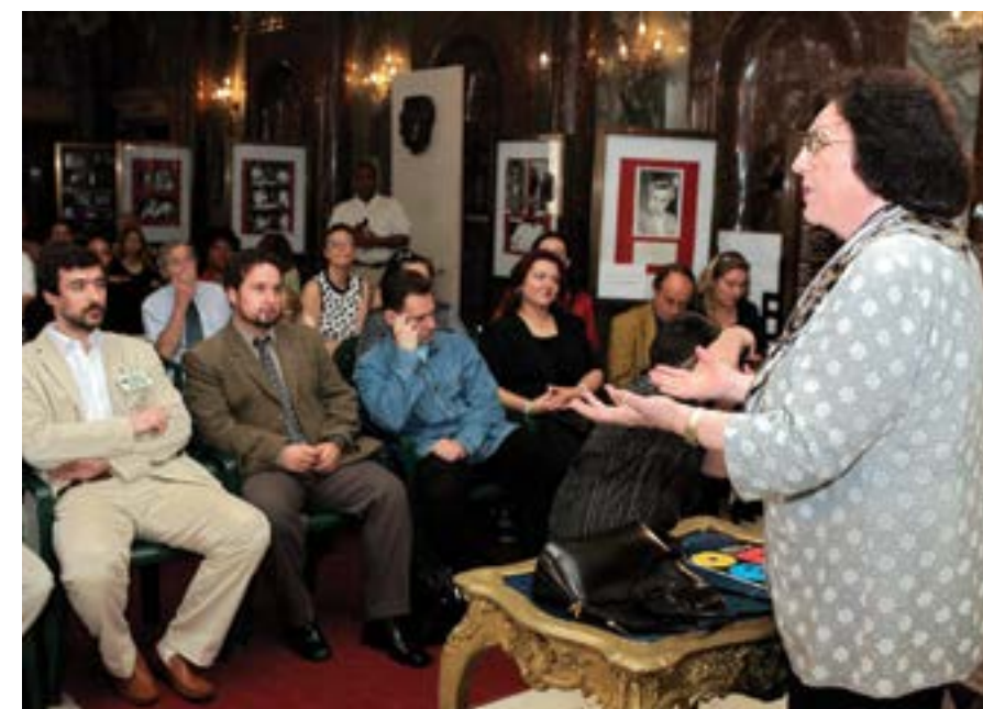
София, 22 юни 2004 г. В Националната опера се състои пресконференция по повод приключването на Тринадесетия международен конкурс за млади оперни певци „Борис Христов“, чийто председател на журито е Гена Димитрова.

Наградата се връчва за първи път тази година и в журито