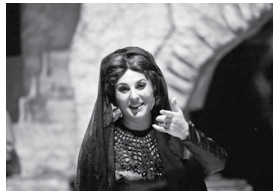
София, 12 февруари 1987 г. Почитателите на оперното изкуство в столицата са покорени от майсторството на н.а. Гена Димитрова. Тя се представя на сцената на Народната опера в ролята на Сантуца от „Селска чест“ на Маскани, с което е отбелязана 20-годишнината на сценичната ѝ дейност.

Изключителното си дарование тя блестяло защитава и тази вечер, за което е щедро възнаградена с аплодисментите на публиката и с много цветя.