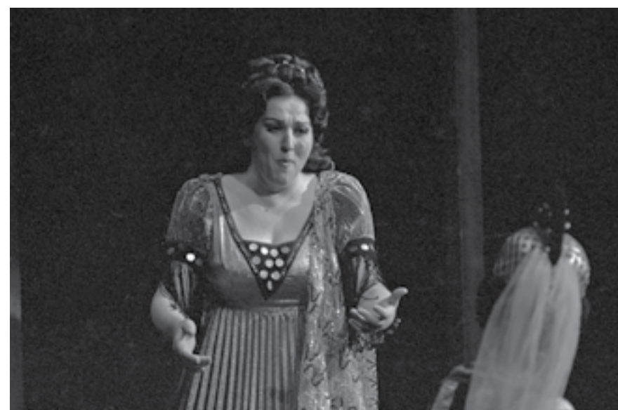
София, 27 май 1983 г. Гена Димитрова в операта „Норма“, с която Софийската народна опера участва в XIV международен фестивал „Софийски музикални седмици“.

„Предварително е ясно, че връх на фестивала този път ще бъдат няколко оперни спектакъла и рецитали на изтъкнати певци. На голямата сцена на Народния дворец на културата пред 4500 зрители ще бъде представена суперпродукция на постановката на Софийската опера на „Дон Карлос“ от Верди с участието на тенора Франко Талиавини, баритона Пиеро Капучила, сопраното Гена Димитрова и Николай Гяуров – бас“, пише още в публикацията.