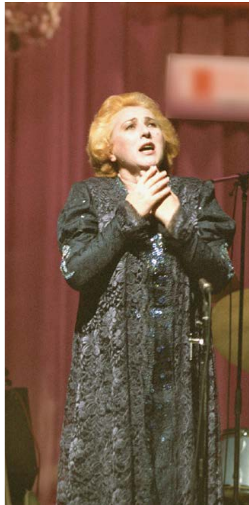
София, 23 април 1990 г. Момент от изпълнението на оперната певица Гена Димитрова в Народния дворец на културата на концерт с редица известни изпълнители, средствата от който ще отидат за развитие на градския транспорт.

Като свидетел на почти целия ѝ път в Софийската опера мога с чисто сърце да твърдя, че Гена Димитрова бе естествена, човечна, състрадателна, отгадена не само на музиката, на операта, но и на близките си, на приятелите. Тя неспирно награждаше, изкачваше се все по-нагоре и по-нагоре, беше безкомпромисна – и към себе си, и към колегите си. Животът ѝ премина предимно по хотели, в чужди градове, в безконечни пътувания и стягане на куфари, но пък имаше късмета до